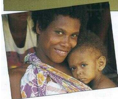
Umfassende Pflege der Kinder: Die Eltern bleiben mit dem Kind im Spital.