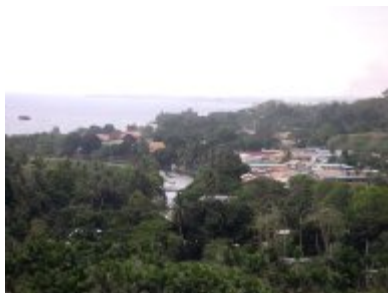
Ausblick vom Mt Austin Richtung Spital

Wir haben die Hauptstadt besucht, die immer gleichen Läden durchstöbert, das Spital mit der „schweizerischen“ Frakturklinik und der Telepathologie inspiziert, den Markt errochen, Chinatown durchschritten und das amerikanische Memorial erklimmen, das für die Soldaten errichtet wurde, die in dieser Gegend gegen die Japaner die wohl entscheidende Seeschlacht des Südpazifiks im 2. Weltkrieg bestritten haben. Sie ist, architektonisch gesehen, keine beeindruckende Stadt. Im Zentrum liegt ein kleiner, älthlicher Hafen, eine scheinbar einzige Strasse zieht entlang des lokal leider recht stark verschmutzten Meeres, beidseitig von ein-