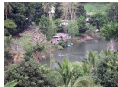
Ausblick vom Mt Austin auf den Mataniko River

bis zweistöckigen Häusern gesäumt. Es ist ein grosses Strassendorf mit Nationalbank, Yachtclub, Nobelhotel und einigen öffentlichen Gebäuden, vierzigtausend Einwohnern, die meisten wahrscheinlich in den Slums, wovon einige auch an erster Adresse liegen. Ohne Schwierigkeiten benutzen wir die kleinen Minibusse, die einem in der Stadt schnell und billig von einem Punkt zum anderen bringen. „Unser“ Haus, leicht ausserhalb der Stadt in einer sehr schönen Anlage in schon etwas luftigerer Höhe gelegen, erlaubte uns schöne Abende im Kreise der manchmal erweiterten Familie.