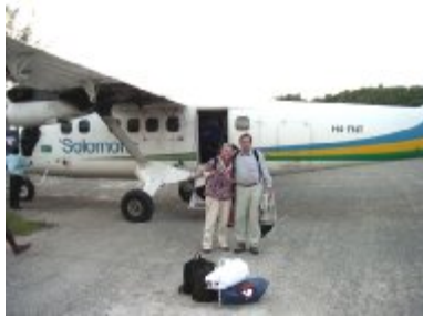
Ankunft in Munda